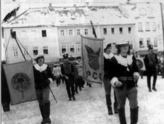
Umzug in Radeburg: 1982 marschiert der PCC erstmals über den Radeburger Marktplatz

In unserer Grundeinstellung „preußisch tolerant und sächsisch gemütlich“ zu sein liegt sicherlich eines der Erfolgsgeheimnisse unseres Vereins.