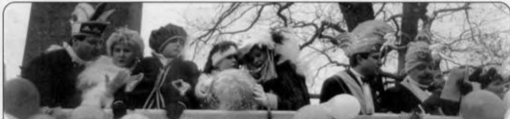
Die Narrenwelt der Umgebung trifft sich zum Umzug in Plessa