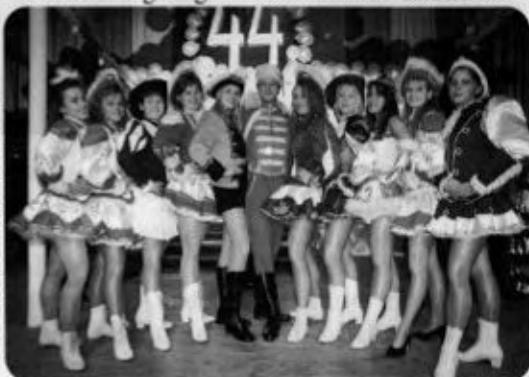
Preußische und sächsische Mädels der Funkengarden friedlich vereint beim 44. Geburtstag des PCC

1984 unter einem jährlich wechselnden Motto standen. In Radeburg wurden neue Ideen für den Umzug abgeschaut. Andere Karnevals-