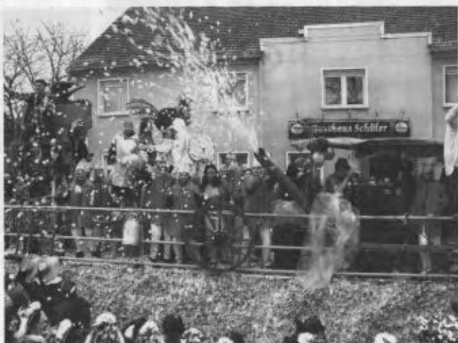
Umzug 2003: Vor der Narrentribüne werden die letzten „Wurfartikel“ verstreut.

„Zum Bauernhof passen Bauernregel“ - sagte man sich. „Ist der 1. März warm und trocken, läßt sich's auch im Freien poppen.“ - lautete